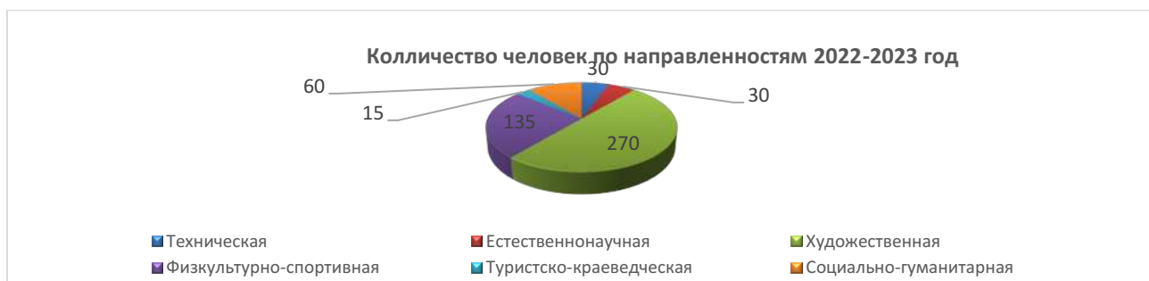
Таблица 9. Направления дополнительных общеобразовательных программ